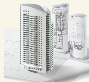
Imóvel na planta?